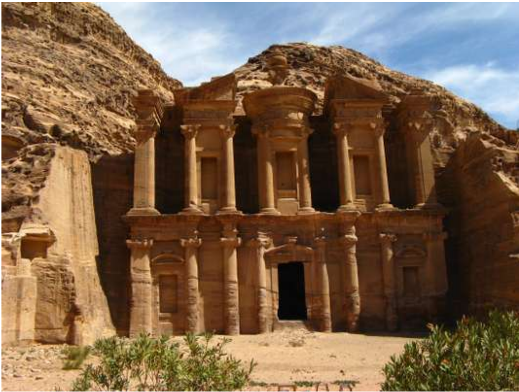
A Pétra, les tombeaux royaux et la façade du Trésor continuent d'éblouir les touristes. FRANCIS

La reprise est très nette en Jordanie, essentiellement parce que l'envie de visiter Pétra ne faiblit pas. Et c'est tellement justifié ! Les tombeaux royaux et la célèbre façade du Trésor sont des chefs-d'œuvre d'architecture éblouissants. A Amman, la capitale, la citadelle et son temple d'Hercule forment un musée en plein air, tandis que le théâtre romain de 6 000 places construit au II e siècle par l'empereur Antonin le Pieux s'intègre gracieusement aux constructions modernes. Le cœur de la ville est très vivant, autour du vieux souk et de la mosquée du roi Hussein. Stable dans une région sous tension, la Jordanie est plébiscitée par les professionnels du tourisme.