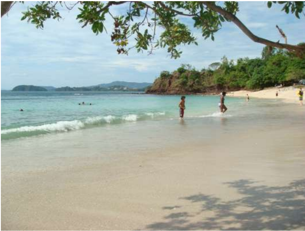
Les eaux translucides de la plage de Conchal, dans la province de Guanacaste.

La province de Guanacaste, au Costa Rica, fait partie de ces coins du monde qui sont d'abord lancés par leurs plages. Sur la côte du Pacifique, au nord du pays, les vagues sont très prisées des surfeurs. Mais les plages de la péninsule et du golfe de Papagayo sont au contraire paisibles. C'est là que règne un des plus beaux hôtels du monde, le Four Seasons Peninsula Papagayo, couvert de multiples récompenses. Parmi ces plages idylliques baignées par l'eau turquoise de l'océan Pacifique, Nacascolo est très peu visitée par les touristes, et il se chuchote que l'eau y est si claire qu'on n'a pas besoin de masque pour observer les poissons. La capitale régionale, Liberia, est une petite ville très authentique, et tout l'arrière-pays offre une nature très sauvage.