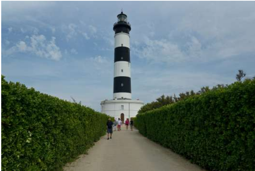
Le phare de Chassiron, sur l'île d'Oléron.

Toute la région des Charentes, des îles à Cognac, et de Royan à Angoulême, ne cesse de progresser : c'est la raison pour laquelle les offices départementaux de tourisme de Charente et de Charente-Maritime s'uniront cette année. Gastronomie prodigieuse, soleil, tarifs assez abordables encore dans de nombreux endroits, les Charentes sont également riches de leur patrimoine. De l'abbaye aux Dames, fondée en 1047 à Saintes, aux villas labellisées « Patrimoine du XX e siècle » de Royan, le choix est vaste et varié. Le tourisme charentais est tiré par la côte, bien entendu, mais l'intérieur des terres vaut largement le détour. En jouant la carte de l'œnotourisme, de la navigation fluviale pour tous et du slow tourisme à vélo, les Charentes innovent et méritent qu'on s'y arrête.