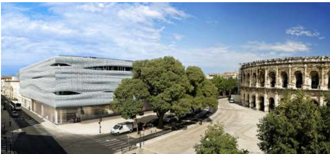
Le futur Musée de la romanité, voisin des arènes, à Nîmes.

Voici l'une des villes les plus profondément méditerranéennes du Midi. Chaude et très ensoleillée, la préfecture du Gard devrait attirer beaucoup de visiteurs à l'occasion de l'ouverture, le 2 juin, de son nouveau Musée de la romanité, si longtemps attendu. Conçu par Elizabeth de Portzamparc, installé juste à côté des célèbres arènes, le bâtiment est « entièrement drapé d'une toge en verre plissé » et