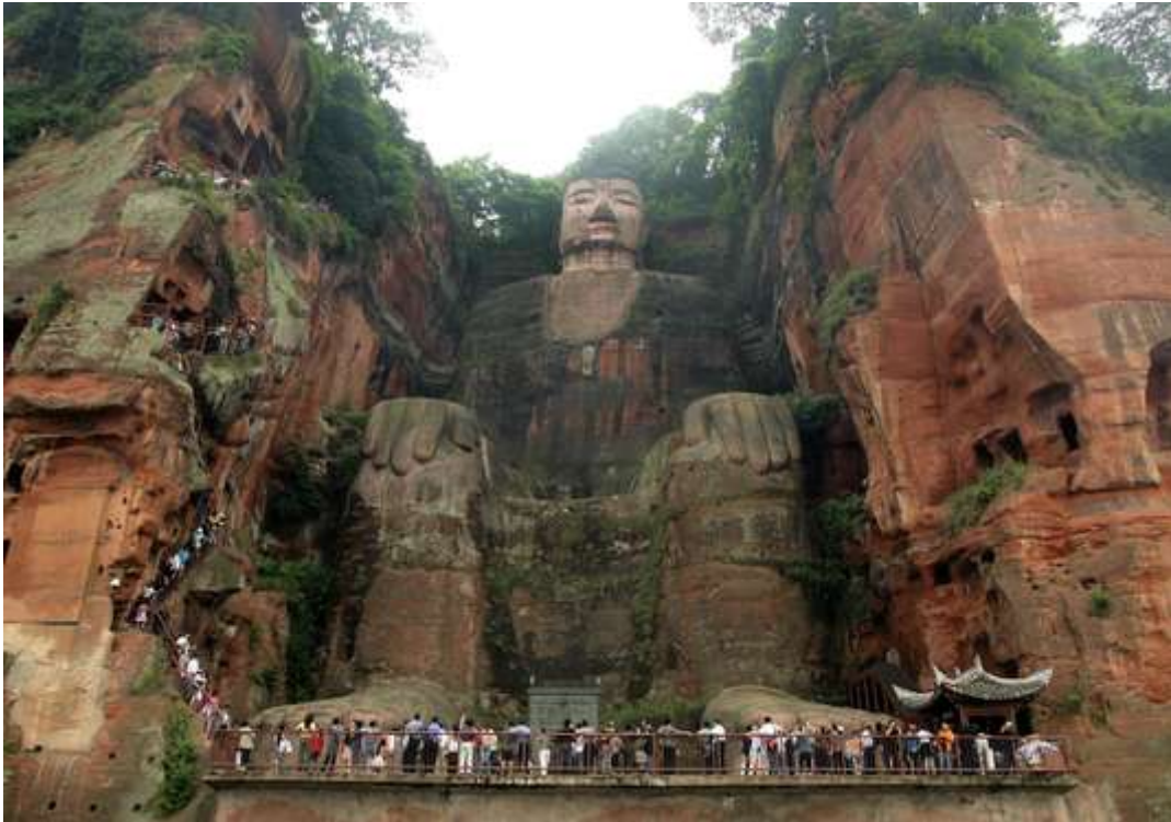
Le Grand Bouddha de Leshan (71 mètres), l'un des incontournables de la région.

Si les villes chinoises n'attirent pas massivement les touristes français, qui craignent à la fois l'hyperactivité ambiante et la pollution, la province du Sichuan échappe à ces réserves. A 80 km au nord-ouest de Chengdu, la découverte du merveilleux système d'irrigation de Dujiangyan, conçu au III e siècle avant notre ère, vaut à elle seule le voyage. A plus de 1 800 km au sud-ouest de Pékin, la région est à la fois connue pour sa gastronomie, ses pandas géants et ses nombreux monuments, dont le célèbre Grand Bouddha de Leshan. Sa capitale, Chengdu, est connue des amateurs d'opéra traditionnel chinois. C'est une ville agréable, où les nombreuses maisons de thé sont accueillantes. Le soir, on dîne d'un poulet impérial aux cacahuètes ou d'une fondue sichuanaise, et on rapporte du poivre du Sichuan à la maison.