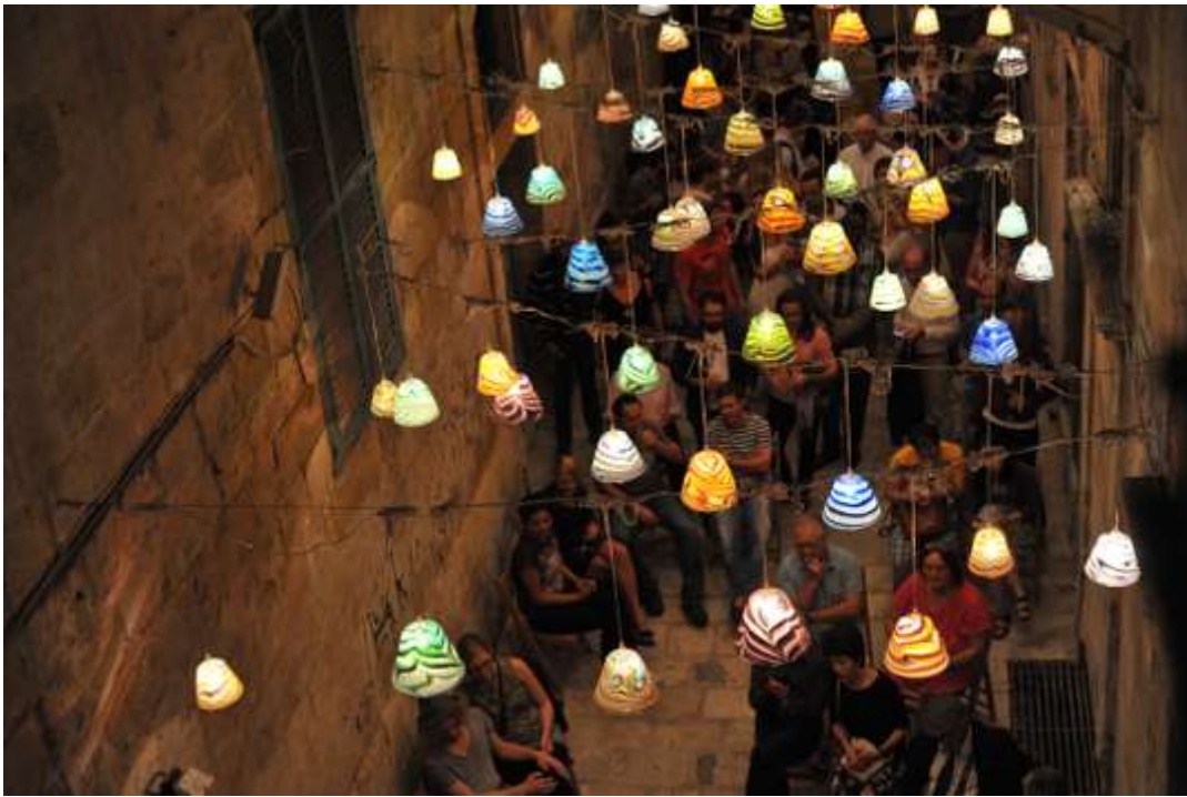
La Strada Stretta, à Malte.

Il y a bien sûr La Valette, désignée Capitale européenne de la culture 2018. Mais pas seulement : l'essor touristique de l'archipel est impressionnant. Malte a désormais largement dépassé les 2 millions de touristes par an, ce qui encourage à y aller avant le trop-plein, qui n'est plus très loin. Les vols pour La Valette sont réguliers et peu chers, la météo clémente, l'île de Gozo – un confetti sauvage au nord de l'archipel –, fantastique, et l'échelle de prix des séjours très large. Valletta 2018 commencera le week-end des 20 et 21 janvier, et l'histoire sera sans doute au centre des festivités. Fondée en 1566, inscrite au Patrimoine mondial de l'Unesco, elle doit son nom à son fondateur français, Jean de Valette, grand maître de l'ordre de Saint-Jean-de-Jérusalem, communément appelé l'Ordre de Malte. L'ouverture du MUŻA, le nouveau Musée des arts de Malte, est, elle, prévue avant la fin de l'année. Installé dans l'Auberge d'Italie, l'ancien fief des chevaliers italiens de l'Ordre de Malte, le MUŻA s'inscrit dans la mouvance de musées « communautaires » qui impliquent la population locale dans leur projet.