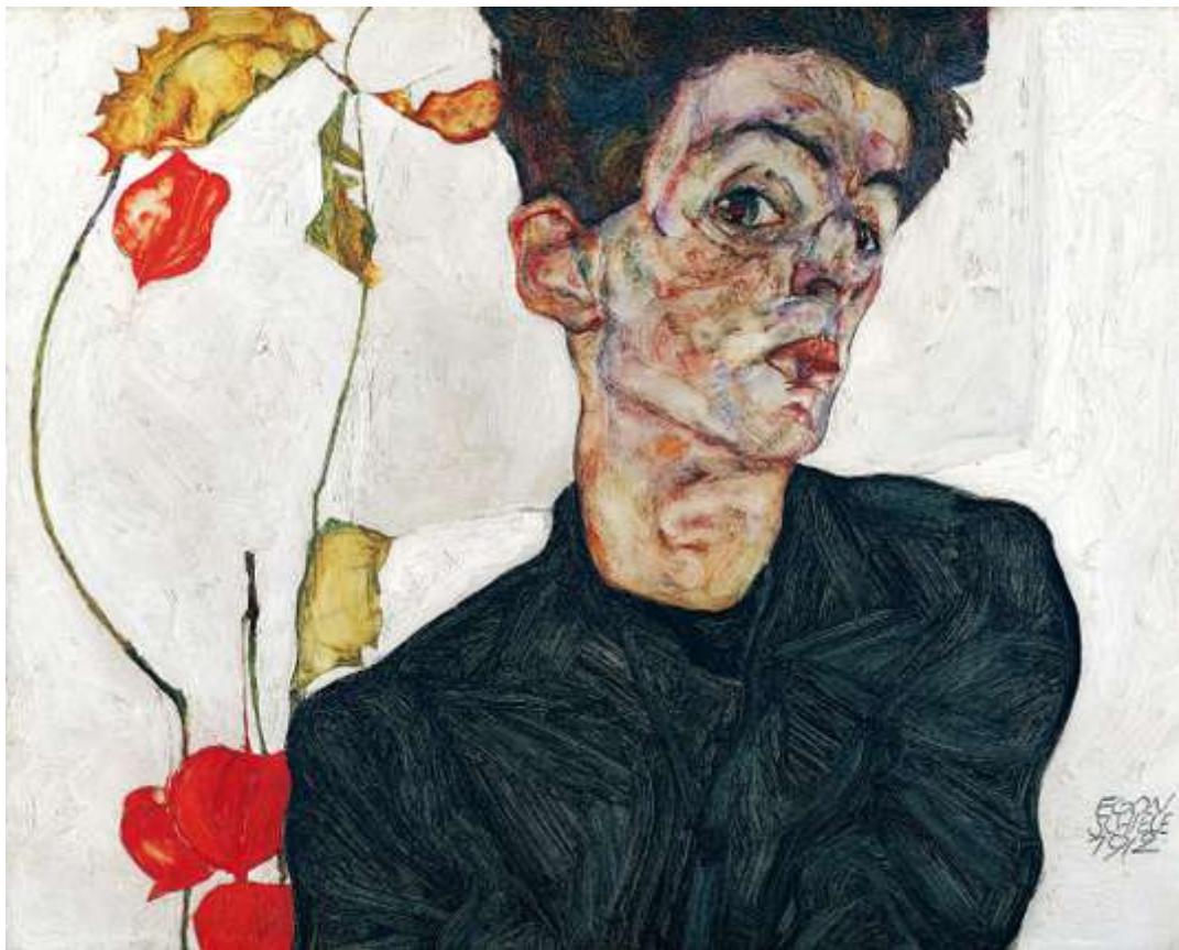
Autoportrait d'Egon Schiele (1912), peintre célèbre cette année dans la capitale autrichienne. LEOPOLD MUSEUM, VIENNA

En 2018, Vienne commémore le Modernisme à travers des expositions et des manifestations consacrées à quatre artistes disparus il y a tout juste cent ans : les peintres Gustav Klimt, Egon Schiele et Koloman Moser, ainsi que l'architecte Otto Wagner. La Vienne de 1900 doit beaucoup à leur talent. Au-delà de ces événements, la ville reste une des capitales les plus inspirantes d'Europe, entre nostalgie de l'Empire et architecture moderne.