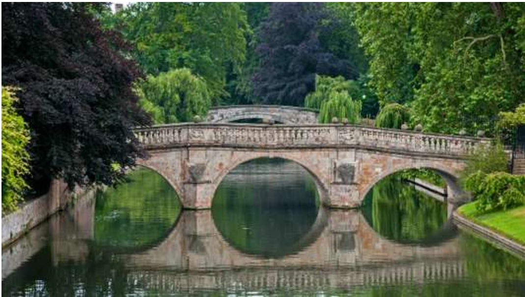
A Cambridge, carte postale de l'Angleterre romantique et paisible. MARTIN PETTITT

La chute de la livre sterling encourage à voyager en Grande-Bretagne à prix doux, par exemple, le temps d'un long week-end à Cambridge. La ville universitaire – célèbre dans le monde entier – est très proche de Londres. Elle incarne l'Angleterre éternelle et l'excellence britannique. La réouverture de Kettle's Yard, un centre d'art étonnant, fera l'événement en février.