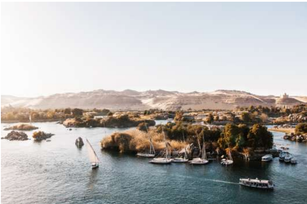
A Assuan, les îles sur le Nil. ZOE FIDJI

L'Égypte est la destination reine de l'Orient méditerranéen. Le tourisme y affiche une vraie reprise, après plusieurs années sombres : de janvier à octobre 2017, 46,9 % d'augmentation des touristes français par rapport à la même période de 2016. La meilleure façon de découvrir le pays, surtout pour une première visite, c'est sa colonne vertébrale, le Nil, loin du tumulte du Caire. La croisière sur le fleuve entre Assuan et Louxor donne accès aux sites les plus importants, comme le temple de Karnak. Le Steam Ship Sudan de Voyageurs du Monde est le plus beau bateau du fleuve, accessible dans une formule 7 jours, dont 3 au Caire, à partir de 2 200 euros. L'ouverture du nouveau Grand Musée Égyptien, non loin des pyramides de Gizeh, est annoncée pour la fin de