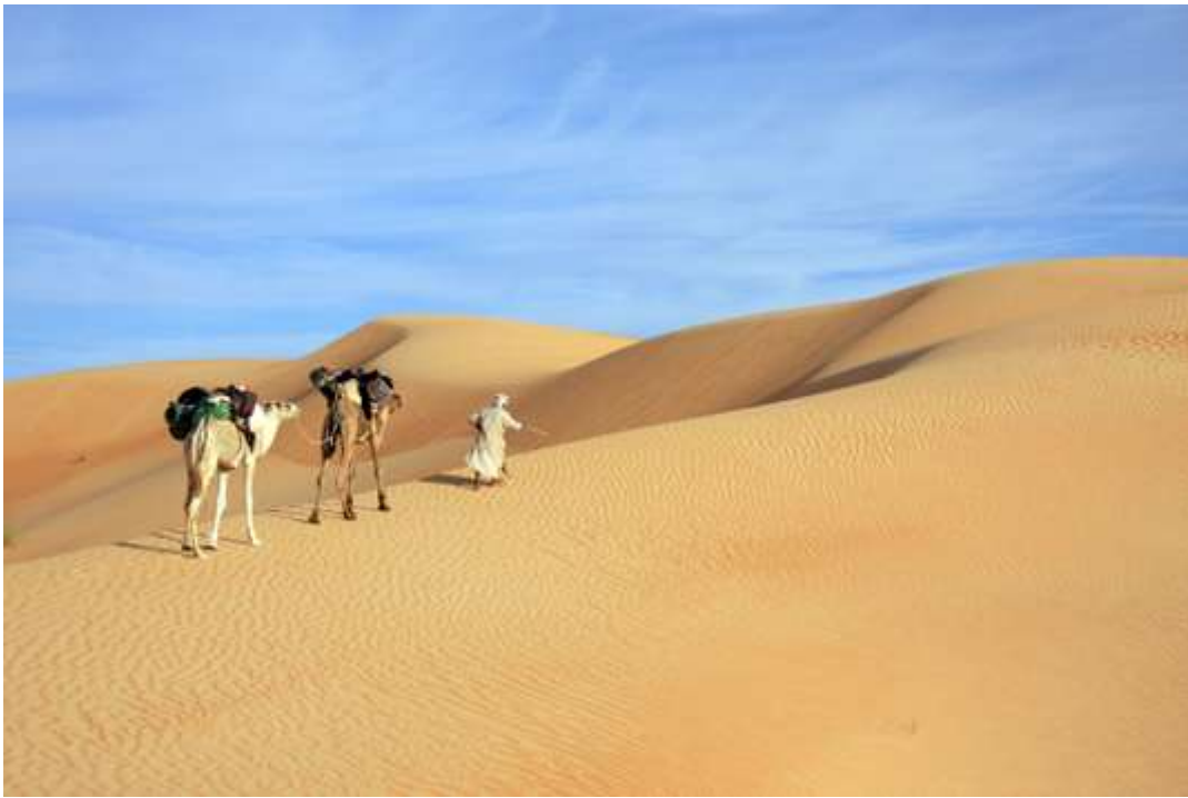
Partez à la recherche du trésor caché du Sahara : l'eau de l'oasis et de sa palmeraie. MICHAEL YPARK

Le Sahara est à nouveau accessible via la Mauritanie, après des années d'interdiction. Avec son circuit randonnée de 8 jours dans les oasis de l'Adrar, Terres d'Aventures ouvre la voie dès ce mois-ci, avec un tarif d'entrée à 1 145 euros. C'est l'occasion unique de (re) découvrir ce désert légendaire qui a vu passer tant d'éminents marcheurs français. Entre les oueds, les canyons et les dunes, le paysage du Sahara cache son trésor : l'eau de l'oasis et de sa palmeraie. Les randonneurs mettent leurs pas dans ceux des caravanes chamelières pour un dépaysement garanti.