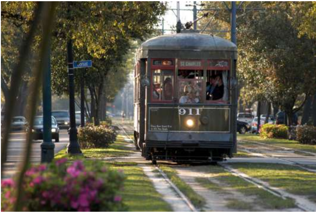
La Nouvelle-Orléans fête en 2018 le tricentenaire de sa fondation.