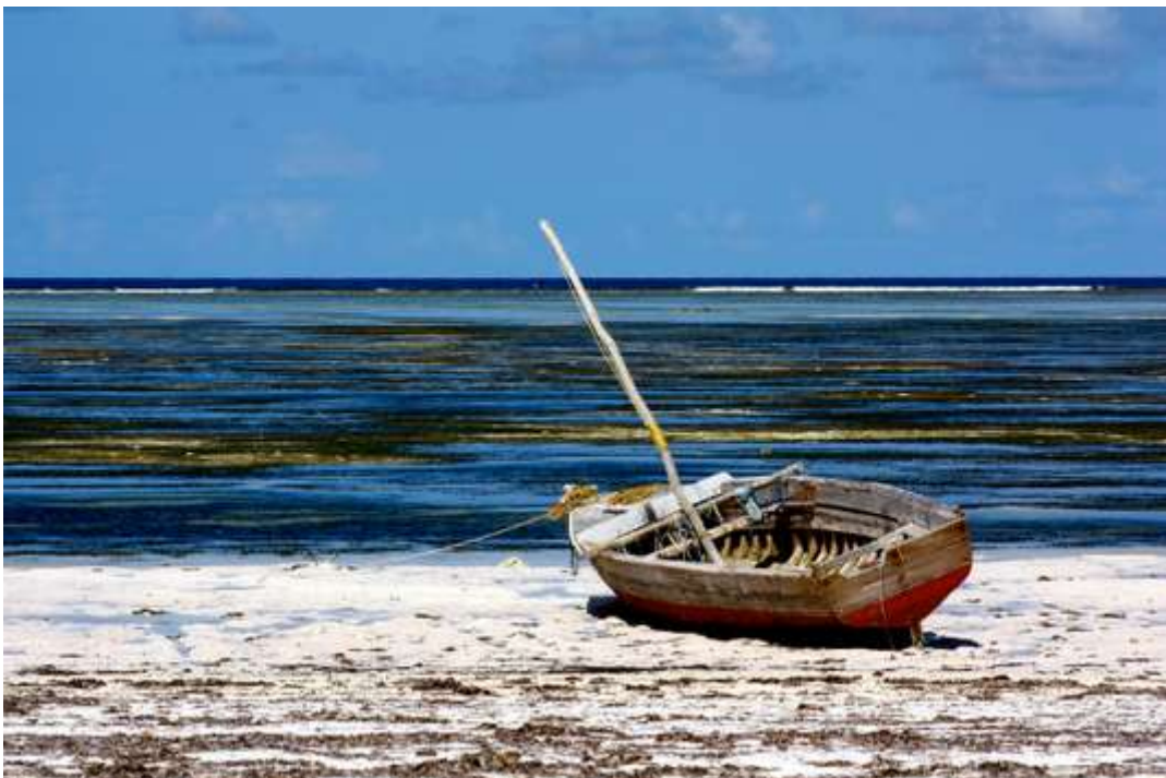
La perle de l'océan Indien attire pour ses plages de sable blanc et ses villages de pêcheurs.

L'île de Zanzibar, en Tanzanie, fait toujours rêver, à juste titre. Cocotiers, plages de sable blanc à perte de vue, villages de pêcheurs, architecture coloniale et saveurs de l'Inde, on n'est déjà plus tout à fait en Afrique sur cette perle de l'océan Indien. Si l'omniprésence d'un islam radical peut être pesante, le dépaysement est total.