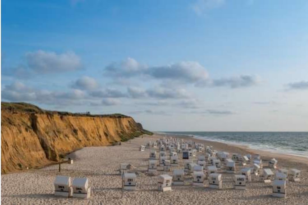
Les charmantes cabines de plage de l'île de Sylt. DRONEPICR

L'Allemagne des villes étant désormais très courue, l'Allemagne maritime s'impose pour respirer l'air du large à Kampen, sur l'île de Sylt. La plus belle des îles frisonnes septentrionales éblouit par le charme de ses cabines de plage mobiles à rayures bleues, ses balades à vélo et sa douceur de vivre en été. Les maisons en toit de chaume et l'extrême discrétion des lieux ont attiré les artistes et les nudistes dès les années 1920. Une certaine jet-set allemande a suivi dans les années 1960. Une destination chic et écolo.