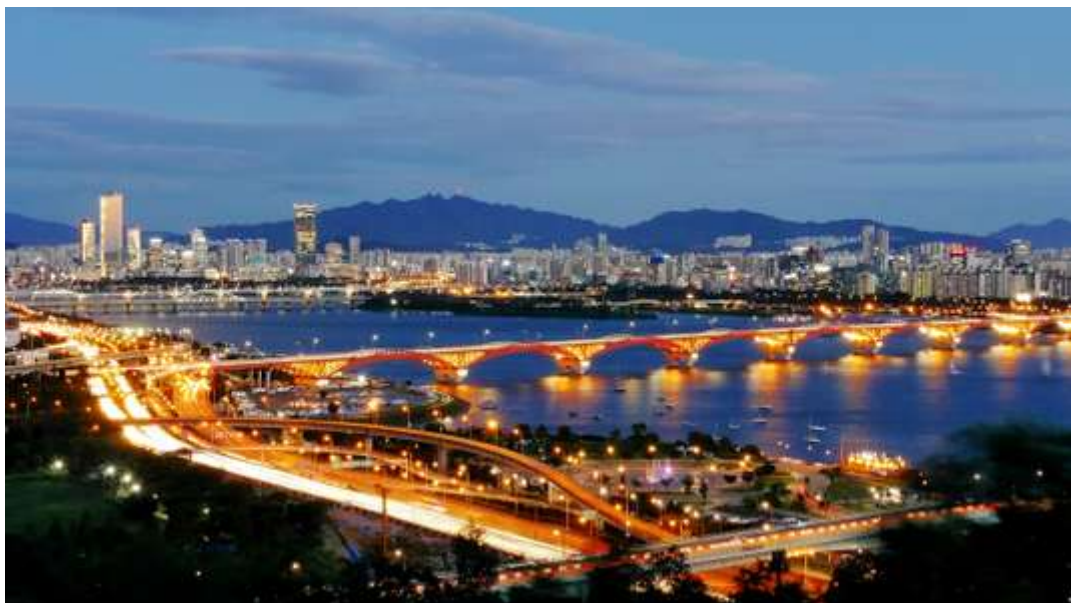
Séoul by night.

Les Jeux olympiques d'hiver se tiendront à Pyeongchang, dans la province de Gangwon, du 9 au 25 février. L'occasion de découvrir une autre facette du pays, celle des montagnes, à l'est de Séoul.